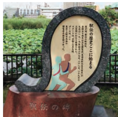
上野恩賜公園は駅伝発祥の地